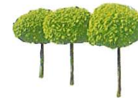
Kleinbaum mit kugelförmiger Krone, z. B. Kugelahorn